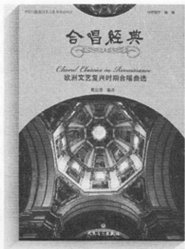
《欧洲文艺复兴时期合唱曲选》